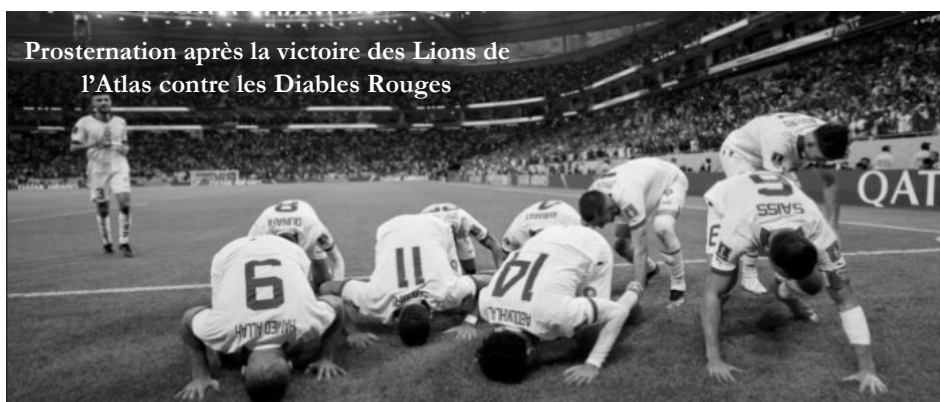
Prostration après la victoire des Lions de l'Atlas contre les Diables Rouges

Pour la première fois dans l'histoire du Mondial, et depuis que l'Afrique a cinq représentants, aucune équipe africaine n'est éliminée après la deuxième journée de ce Mondial 2022. Cependant, aucune équipe africaine n'a pu aller loin en Coupe du Monde où ce continent est y est représenté depuis... 1934 avec la première participation de l'Égypte. Le Cameroun, en 1990, le Sénégal en 2002 et le Ghana en 2010 sont les équipes ayant atteint les quarts de finale mais sans les dépasser.