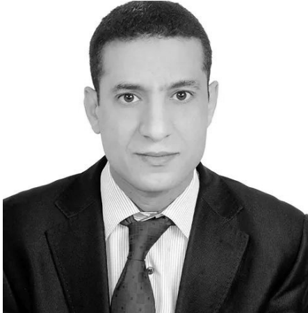
Par Abdel-Jalil Zaidane , Tétouan (Maroc)

P oint de jonction géostratégique entre les continents africain et européen, le Maroc est un espace d'émigration et de transition idéal vers l'Europe, et ce, avant qu'il soit à son tour un pays d'accueil et de destination finale pour les immigrants.