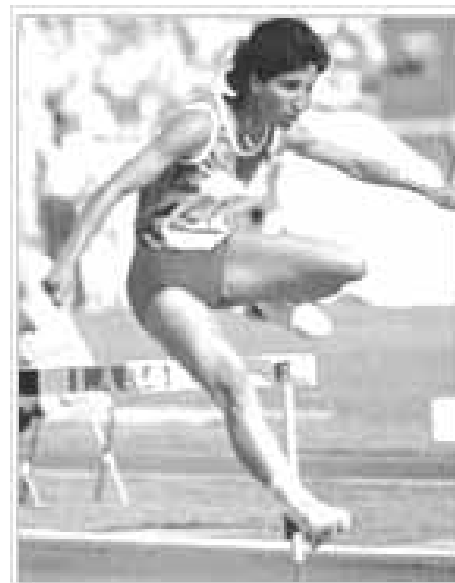
Nawal Moutawakil, médaille d'or 400 mètres haies aux jeux olympiques de Los Angeles 1984.

Le 10 octobre 2003 fut une journée historique pour les femmes marocaines quand le Roi Mohammed VI a annoncé, lors de son discours d'ou-