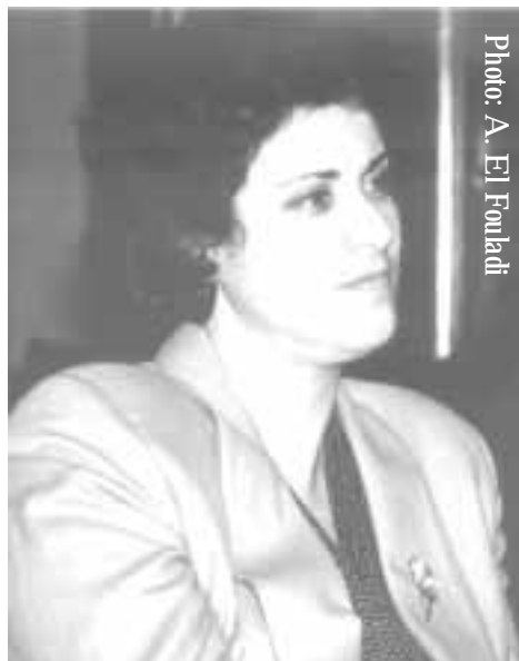
Farida Jaidi, Ambassadeur du Maroc en Suède

Ambassadrices de charmes des arts et de la culture, chaque événement auquel elles participent, chaque œuvre qu'elles réalisent construisent l'image de marque du Maroc à l'international et contribuent inéluctablement à la promotion de la femme.