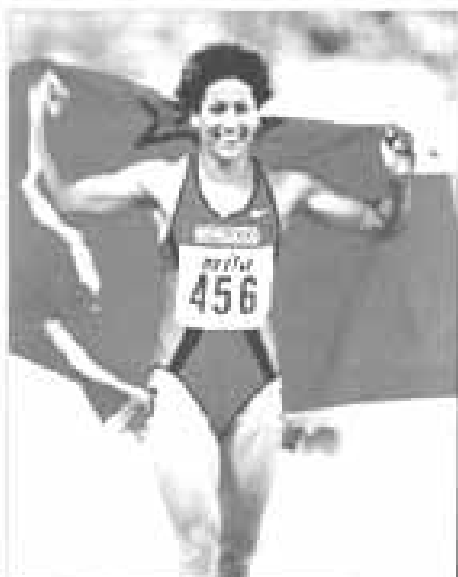
Nezha Bidouane, 1ère au championnat du monde du 400 mètres haies, Johannesburg 1998

précédent, qui date de 1957, disparaîtra en faveur d'une égalité des droits et devoirs.