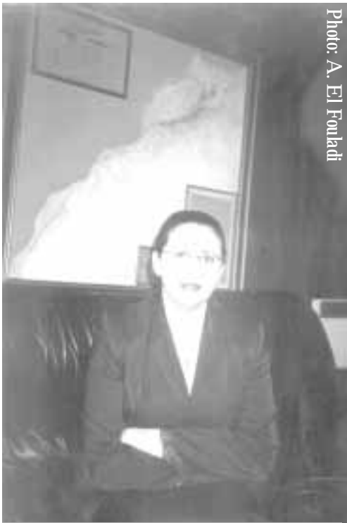
Nouzha Chekrouni, Ministre au gouvernement actuel