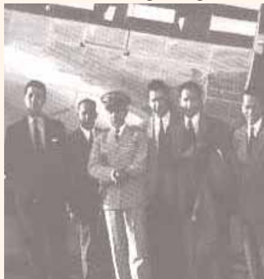
Ben Bella, à gauche, avec ses compagnons et le Prince Moulay Hassan avant le décollage du DC3, le 22/10/56