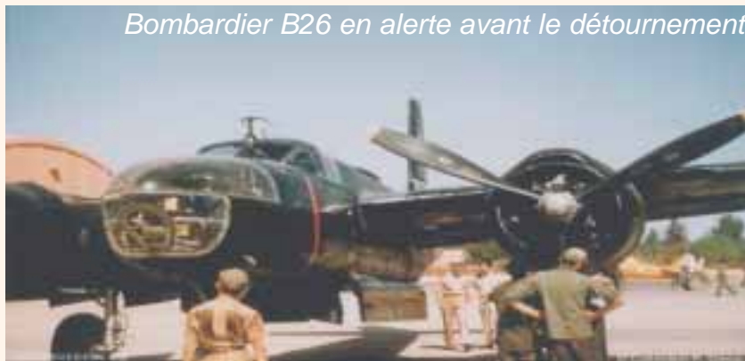
Bombardier B26 en alerte avant le détournement