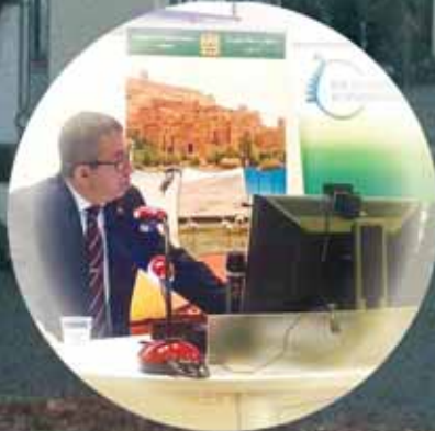
Entretien avec l'Ambassadeur du Maroc en Australie (Pages 4 et 5)