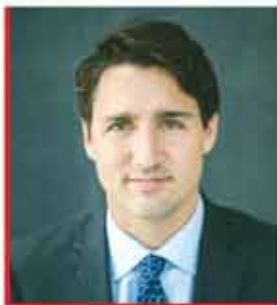
TRÈS HON. Justin Trudeau MP / Député Papineau Justin.Trudeau.c1c@parl.gc.ca (514) 277-6020

HOUSE OF COMMONS CHAMBRE DES COMMUNES CANADA