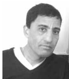
Par Mustapha Bouhaddar

D imanche 26 Mai, vers 10 h, je me suis dirigé nonchalamment vers le bureau de vote de ma commune pour exercer mon devoir de citoyen.