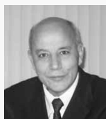
Par Abderrahman El Fouladi

Ce soir du 11 mai 2019, je me fis inviter chez les survivants de la fusillade, survenue le 15 mars 2019 à la Mosquée An-Noor de Christchurch (Nouvelle Zélande).