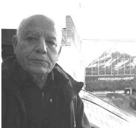
Par Abderrahman El Fouladi

Quand j'eus atterri à Christchurch ce 11 mai 2019, en début d'après midi, je n'étais même pas sûr de trouver ne serait-ce qu'un seul Marocain dans cette petite ville d'apparence paisible, mais qui connut, le 15 mars dernier, le pire massacre jamais vu contre une minorité religieuse néozélandaise; massacre qui traumatisa la Nation toute entière mais qui montra à tel point le peuple néozélandais est soudé, inclusif, empathique et compatissant.