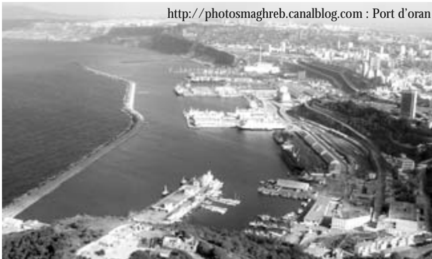
Port d'oran

Cette mesure "vise l'amélioration des conditions d'approvisionnement des entreprises de production", selon le communiqué publié à l'issue de ces consultations. Si les fabricants doivent