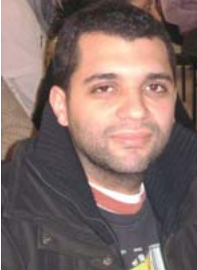
Par Salaheddine Lemaizi