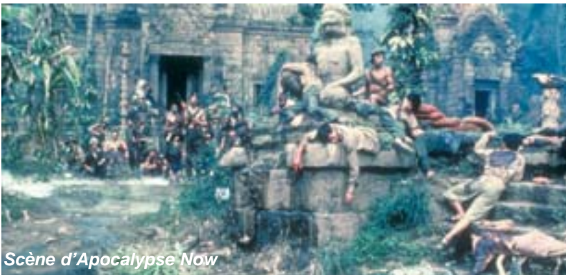
Scène d'Apocalypse Now

En conclusion, si il y avait plus de Hector Macdonald dans le monde de l'édition et des médias, nous serions peut-être moins facilement les marionnettes aveuglées par les demi-vérités ou les mensonges que le pouvoir veut nous faire avaler.