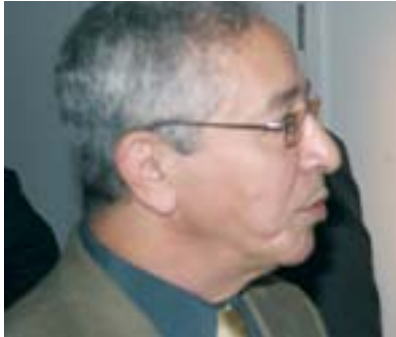
Par Youcef Bendada

Alors que dans certaines rues arabes la grogne enfle, dans d'autres la population, à force d'abnégation dans la protestation a réussi à imposer ses revendications économique, sociale et surtout politique. Les succès obtenus par les jeunes Égyptiens et Tunisiens qui, aujourd'hui, sont presque maîtres de leur destin après avoir obtenu, ce qui était impensable il y a juste deux mois, soit le départ d'un personnel politique qui les a privé de liberté et écrasé sous un régime dictatorial méprisable, démontrent que l'insoupçonnable rêve des opprimés peut devenir réalité.