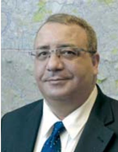
Par Dr Camille Sari, Économiste

Le Roi du Maroc (cf. le discours du 9 mars 2011) et Le Président Algérien (discours du 12 avril 2011) s'accordent sur la nécessité d'amender leurs constitutions respectives, d'élargir les libertés individuelles et collectives, de garantir la liberté de la presse et d'aller plus en avant vers une décentralisation administrative et l'octroi de réelles responsabilités aux collectivités territoriales. L'amazighité comme composante de la culture nationale voire comme langue nationale est reconnue !