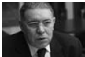
Med Bennis, page 30