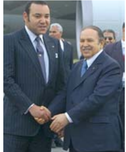
Le Roi du Maroc, Mohammed VI et le Président algérien Abdelaziz Bouteflika

Il n'est pas normal qu'à l'occasion d'une visite royale ou présidentielle, les