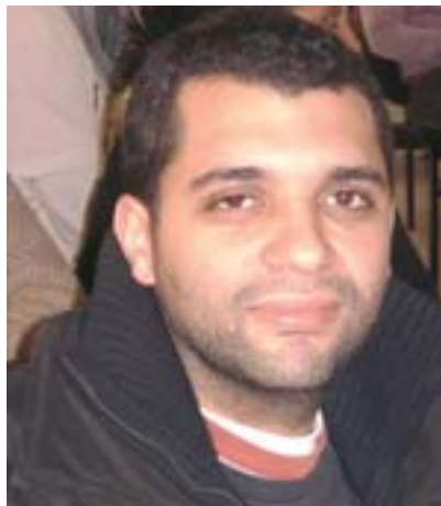
Par Salaheddine Lemaizi