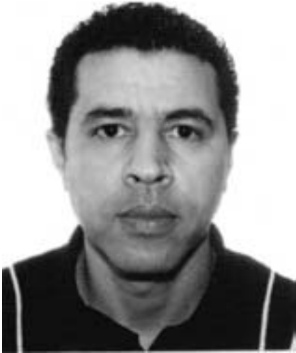
Par Jawad Najem

Le printemps Arabe est-il un vrai printemps ou tout simplement une verdure, suite à un orage, donc éphémère ... Qui sera flétri par la tradition politique locale où le vent de l'autoritarisme finit par tout assécher sur son passage, comme tout vent du désert qui se respecte ? Ceci sans oublier les occidentaux qui n'accepteront jamais que leurs intérêts soient menacés, comme le croient les auteurs des articles qu'on lira plus loin ? Qu'en pense M. Jawad ?