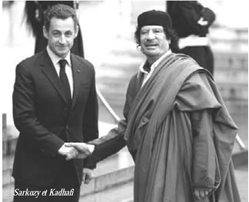
Sarkozy et Kadhafi

Pendant ce temps là, le colonel Kadhafi ne désarme pas. Malgré les bombardements de la coalition internationale, le leader libyen a une nouvelle fois affiché, lors d'une intervention télévisée mardi soir, sa détermination. « À court terme, nous les battons, à long terme, nous les battons » a-t-il lancé depuis sa caserne de Bab el-Aziza, à Tripoli. Sur le terrain, ses troupes ont été bombardées le 23 mars par la coalition à Misrata. Mais elles tenaient toujours Ajdabiyah. La victoire est ainsi loin d'être acquise pour les re-