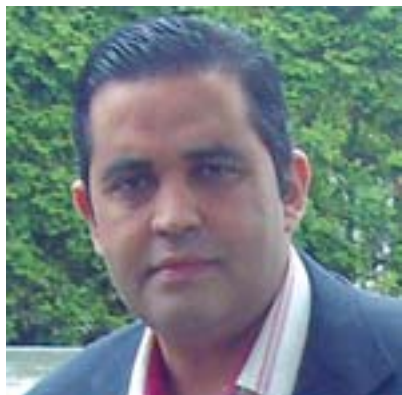
Par Said Chayane

Le Derby maghrébin a tenu toutes ses promesses et a démenti les mauvaises langues qui prédisaient que ce match allait être un " remake du drame d'Oum Darman ", en faisant allusion au mauvais souvenir du match Algérie Égypte et à ses conséquences sur la relation entre les deux pays arabes