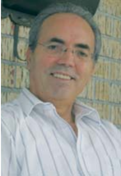
Par Youssef Nacef Laval, Québec.

J e vous lis presque à tous les jours et ce, depuis des années. Je trouve que vos réponses sont en général rationnelles et judicieuses.