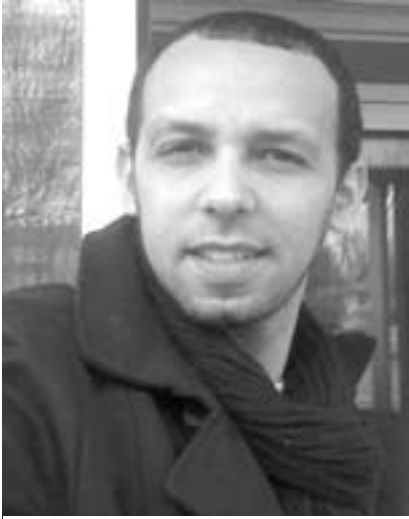
Par Mohamed Chahid

Dans un article intitulé « Les trois blessures narcissiques de l'homme occidental », j'avais essayé de reprendre, non sans un certain sarcasme, la thèse élaborée par Freud au sujet des trois blessures narcissiques infligées à l'homme occidental par la science moderne. Au moment où j'avais publié l'article, j'avais promis aux lecteurs de rédiger un texte sur les blessures infligées à l'homme oriental. Chose promise, chose due.