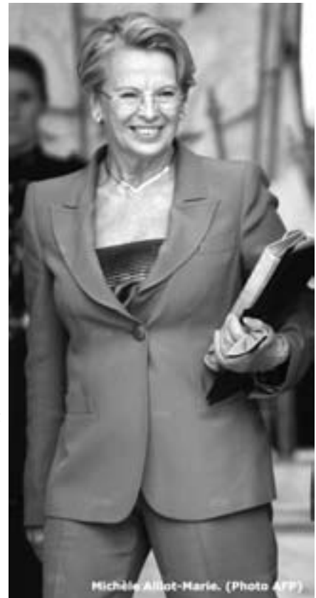
Michèle Alliot-Marie.

Une autre bourde de la ministre des affaires étrangères mais de moindre calibre cette fois-ci, qui se rajoute à la précé-