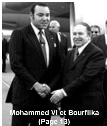
Mohammed VI et Bourflika (Page 13)