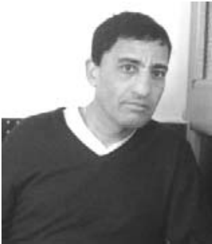
Par Mustapha Bouhaddar

J'ai passé une semaine en Tunisie le mois de novembre dernier: Il faut être aveugle pour ne pas ne pas y voir et sentir, le climat d'oppression et d'intimidation, que subissait le peuple tunisien.