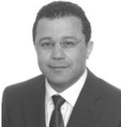
Par Kamal El-Batal

Stratégies du Chaos, jeux politiques ou volonté sincère pour accompagner les peuples arabes dans la quête de liberté, estime, fierté et de leur développement social, humain et économique, difficile de le savoir excepté la poignée d'Hommes qui contrôle le pouvoir dans les trois principaux États : faiseurs de démocratie et d'anti-démocratie, à savoir: la France, l'Angleterre et les U.S.A qui eux-mêmes, sont aussi contrôlés par le pouvoir invisible des sociétés secrètes !