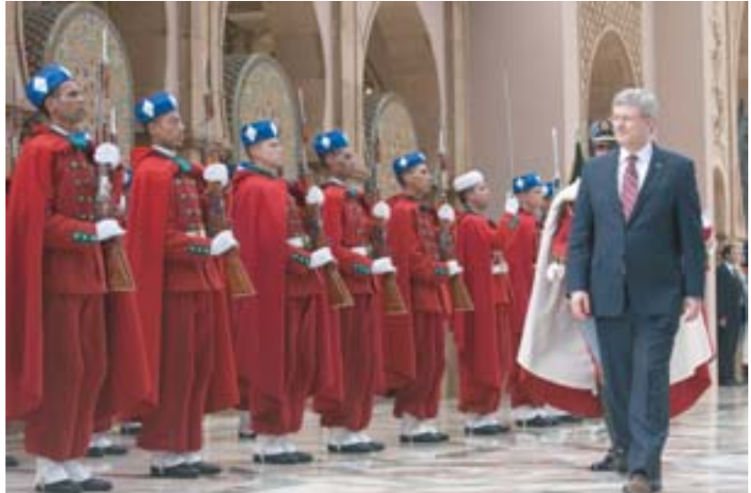
« Le Canada apprécie grandement ses relations de longue date avec le Maroc et il est fier d'appuyer les efforts de ce dernier pour moderniser son système d'éducation et renforcer son économie. Le soutien annoncé aujourd'hui multiplier les possibilités pour les jeunes gens de prendre part à l'économie marocaine croissante. » S. Harper Premier ministre du Canada, le 27 janvier 2011.

* Le Projet d'appui à la réforme de l'éducation par le biais de l'approche par compétences soutiendra les efforts de