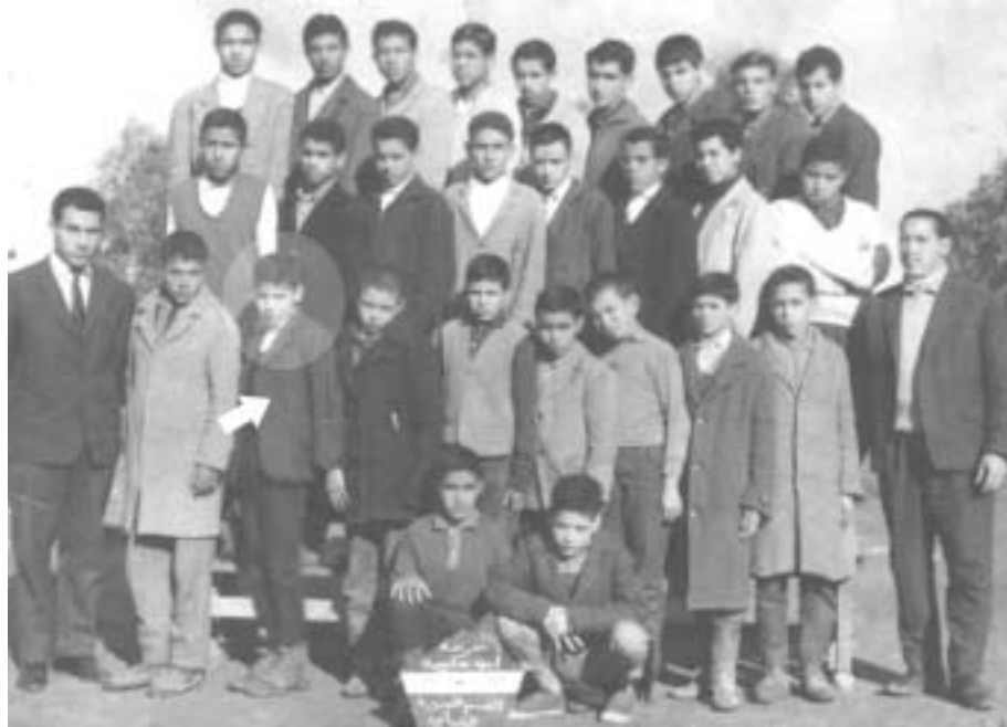
1962: Avec mes condisciples du cours moyen 2 ème année, mon maître de Français (à gauche), mon maître d'Arabe (à droite) et mes brodequins « King size » (à mes pieds).

Ma réponse déclenche toute une discussion entre les deux hommes, discussion où ils ont échangé des arguments dont la logique et le contenu sont au delà de ma compréhension. Je leur tourne donc le