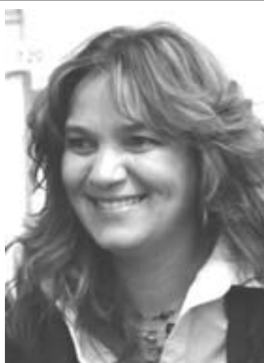
Betty Batoul, écrivaine Belgo-Marocaine