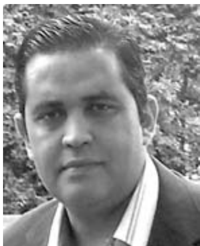
Par Saïd Chayane, BAA -MBA

Au moment où nous mettons sous presse, le Derby casablancais numéro 109 Raja-Wydad va se jouer le Samedi 4 Décembre à 15h au complexe Mohamed V à Casablanca... Après 4 reports !