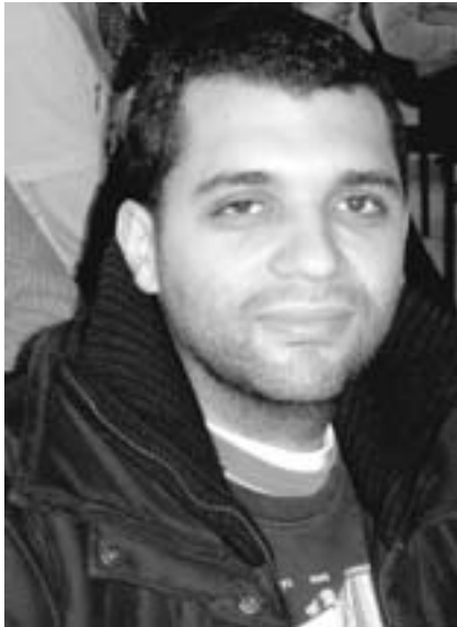
Par Salaheddine Lemaizi, journaliste (Maroc)