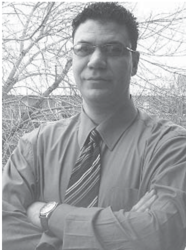
Par Mostafa Benfarès, Ph.D.

Depuis toujours, et jusqu'à nos jours, la situation des immigrants en matière d'emploi est toujours la même. Rien n'a été changé. le constat s'aggrave au jour le jour et prête beaucoup à réfléchir. Dernièrement, il y avait deux rapports inquiétants qui viennent sonner l'alarme et sensibiliser les responsables : Le rapport de la banque TD(1) et le bulletin sur la prospérité du Québec(2). Qu'en est-il donc de la place de l'intégration réussie dans ces deux rapports ?