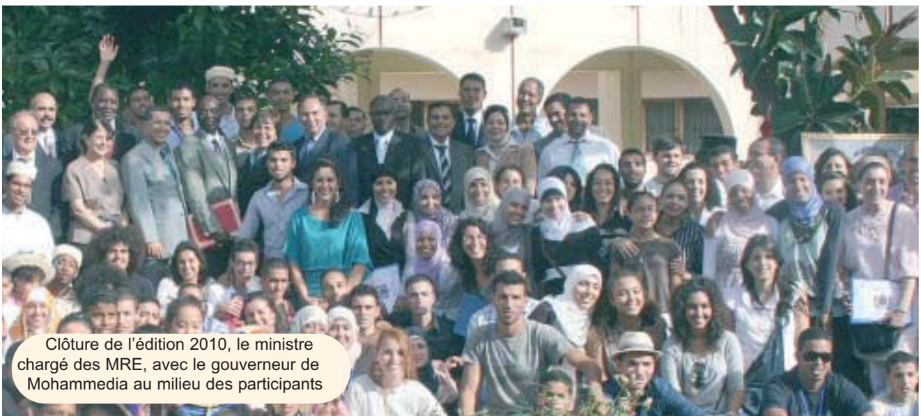
Clôture de l'édition 2010, le ministre chargé des MRE, avec le gouverneur de Mohammedia au milieu des participants